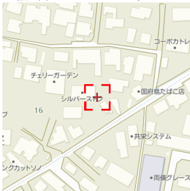
〔(C) ZENRIN Z17LE第1140号〕