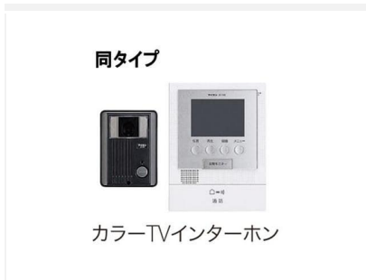
カラーTVインターホン