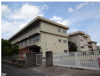
天満屋北*ヶの原尾島店(610m)