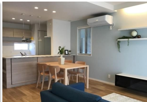
(リビング・ダイニング:オーク色の床にアクセント壁紙)

敷地面積: 159.83㎡ (48.34坪) 【建物面積】 1F 床面積: 55.48㎡ 2F 床面積: 56.31㎡ 延べ床面積: 111.79㎡ (33.81坪) ※蔵・ロフトを除く