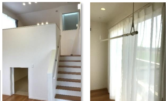
(KURA付セパレート寝室) (室内干しコーナー)

敷地面積: 159.83㎡ (48.34坪) 【建物面積】 1F 床面積: 55.48㎡ 2F 床面積: 56.31㎡ 延べ床面積: 111.79㎡ (33.81坪) ※蔵・ロフトを除く