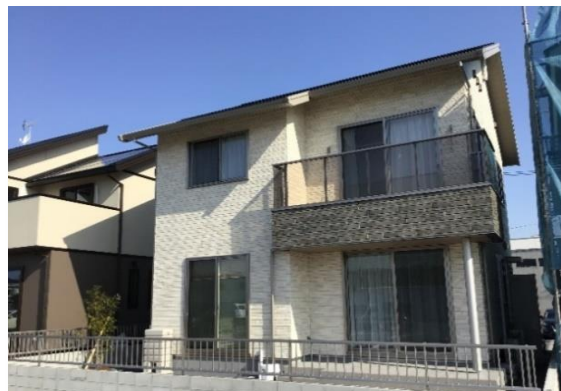
(建物外観:南東から)