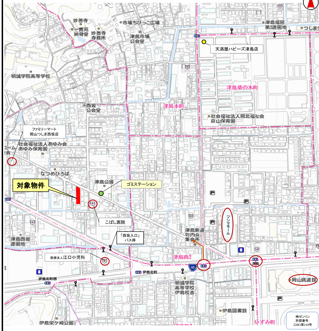
地図又はイラスト