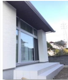
(建物外観:南のテラス)