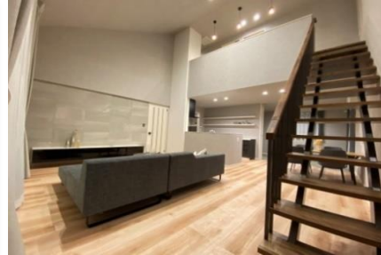
(リビング:スリット階段)