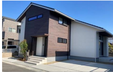
(建物外観:南西から)