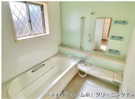
「浴室リフォーム前」クリーニング予定