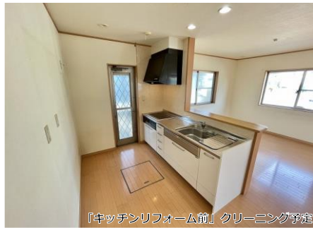
「キッチンリフォーム前」クリーニング予定