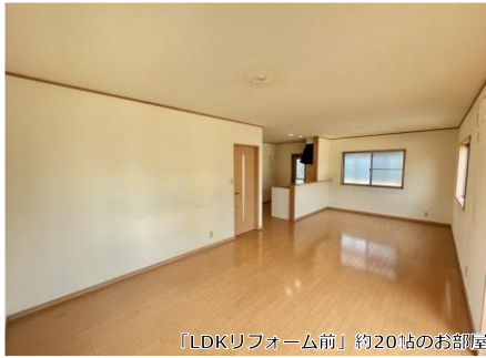
「LDKリフォーム前」約20帖のお部屋