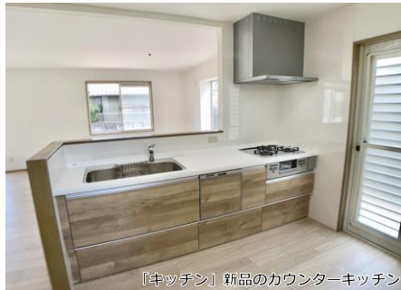
「キッチン」新品のカウンターキッチン