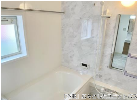
「浴室」広々としたユニットバス