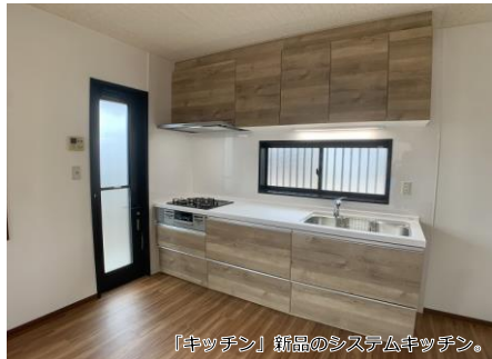
「キッチン」新品のシステムキッチン。