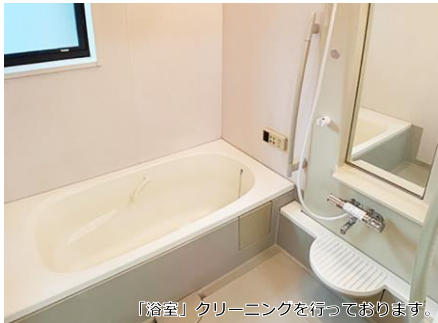
「浴室」クリーニングを行っております。