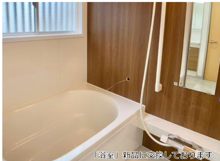
【浴室】新品に交換しております。