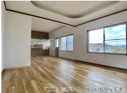
【LDK】窓が多く、明るなお部屋です。