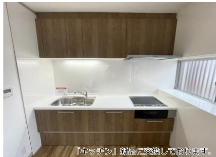
【キッチン】新品に交換しております。