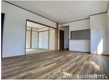
「LDK」約15.8帖のお洒落です。