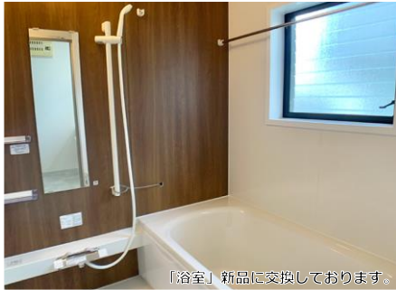
「浴室」新品に交換しております。