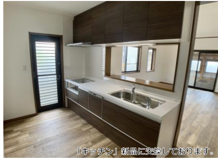
「キッチン」新品に交換しております。