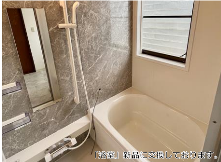
「浴室」新品に交換しております。