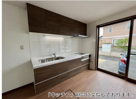
「キッチン」新品に交換しております。