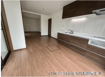
「LDK」約16.6帖のお部屋です。