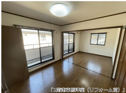
「2階南東側洋室(リフォーム前)」