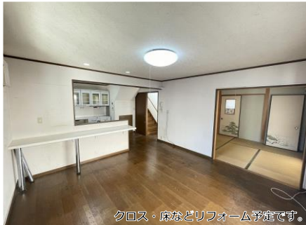
クロス・床などリフォーム予定です。