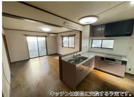
キッチンが新品に交換する予定です。