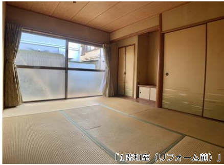
「1階和室(リフォーム前)」