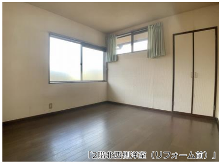
「2階北西側洋室(リフォーム前)」