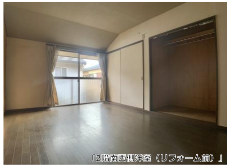
「2階南西側洋室(リフォーム前)」