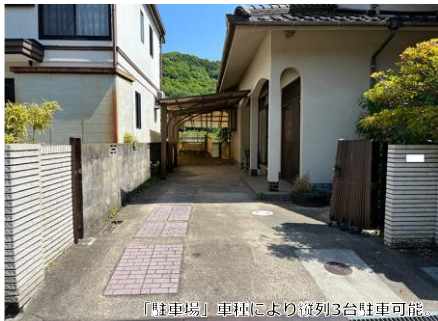
「駐車場」車種により縦列3台駐車可能