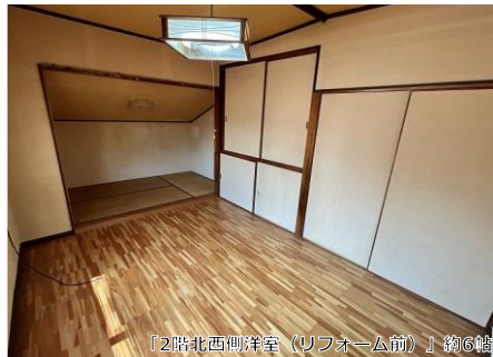
「2階北西側洋室（リフォーム前）」約6帖