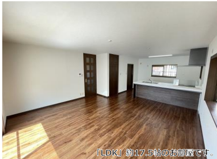
「LDK」約17.5帖のお部屋です。