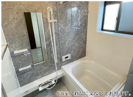
「浴室」新品に交換しております。