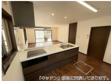
「キッチン」新品に交換しております。