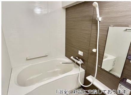
「浴室」新品に交換しております