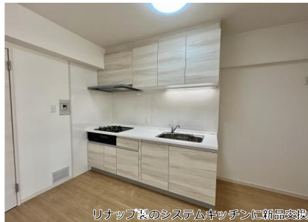
リナッパ製のシステムキッチンに新品交換