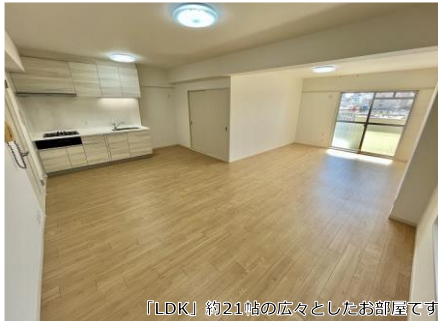
「LDK」約21帖の広々としたお部屋です