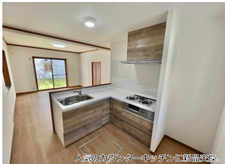
人気のカウンターキッチンに新品交換。