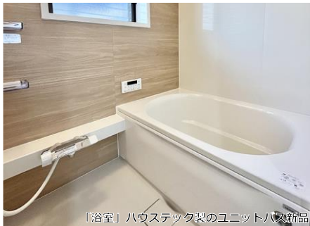
「浴室」ハウステック製のユニットバス新品