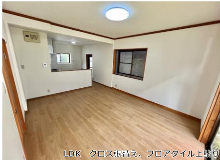
LDK クロス張替え、フロアタイル上貼り