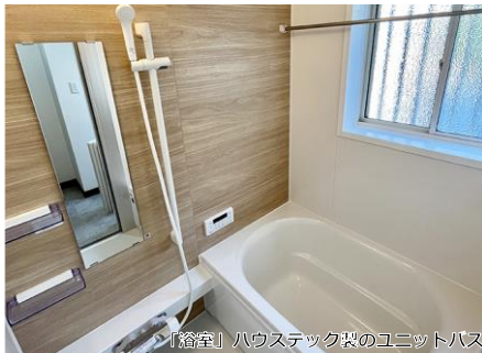
「浴室」ハウステック製のユニットバス