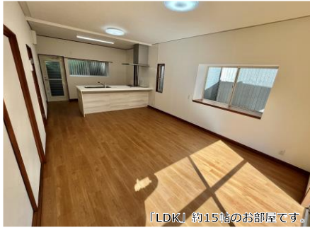
「LDK」約15帖のお部屋です。