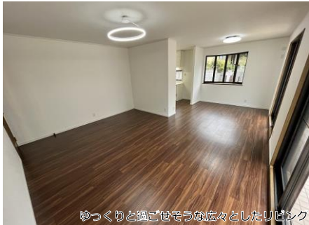
ゆっくりと過ごせそうな広々としたリビング