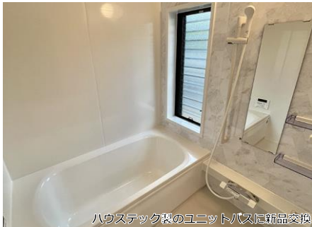
ハウステック製のユニットバスに新品交換