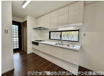
クリナップ製のシステムキッチンに新品交換