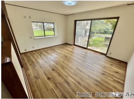
【LDK】クロス張替え済み