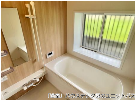
【浴室】ハウステック製のユニットバス