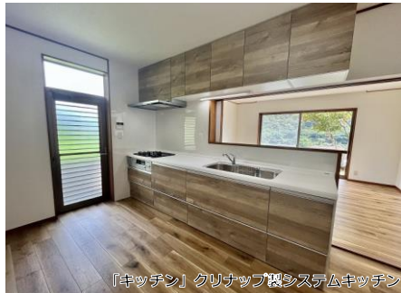
【キッチン】クリナップ製システムキッチン