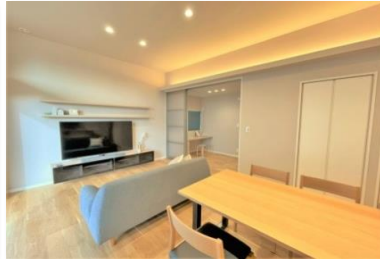
(リビング:間接照明)