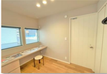
(1階マルチスペース)