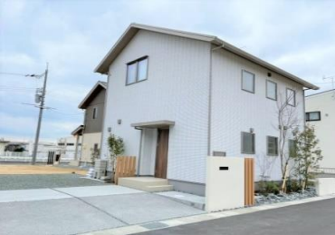
(建物外観:北東から)