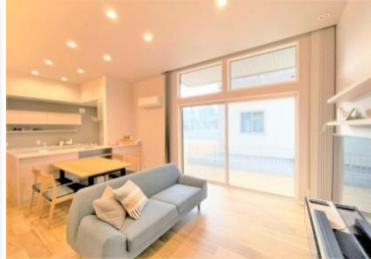
(リビング:ハイサッシ)