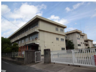
天満屋ビル*の原尾島店(610m)